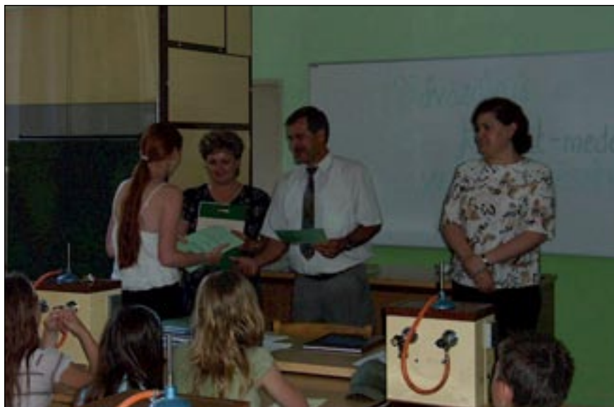
A díjátadás pillanata